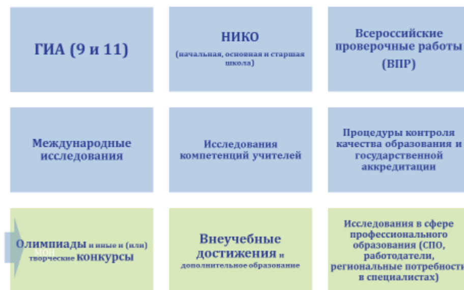
Система оценки качества образования в ГБОУ СОШ №323

Придание гласности результатам оценки качества образования осуществляется в следующих формах: